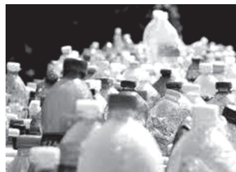
プラスチックゴミ